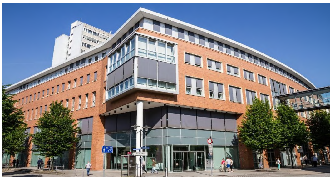
Rathaus I

Herausgeber: Stadt Hagen - Der Oberbürgermeister Redaktion: Fachbereich des Oberbürgermeisters, Rathausstraße 13, 58095 Hagen, Telefon 02331 2072687, Fax 02331 2072401 (v.i.S.d.P. Thomas Bleicher) Erscheinungsweise: Nach Bedarf, freitags. Bezug: Kostenlos erhältlich im Volme Forum, Zentrales Bürgeramt, Rathaus I, Rathausstraße 11, 58095 Hagen. Digital unter www.hagen.de und über unseren QR-Code kostenlos zum Download. Abonnement über Versand oder digital als PDF-Datei per E-Mail ist möglich (30,-€/jähr.). Vertrieb: Heike Heinig, Telefon 02331 2072687, E-Mail: heike.heinig@stadt-hagen.de