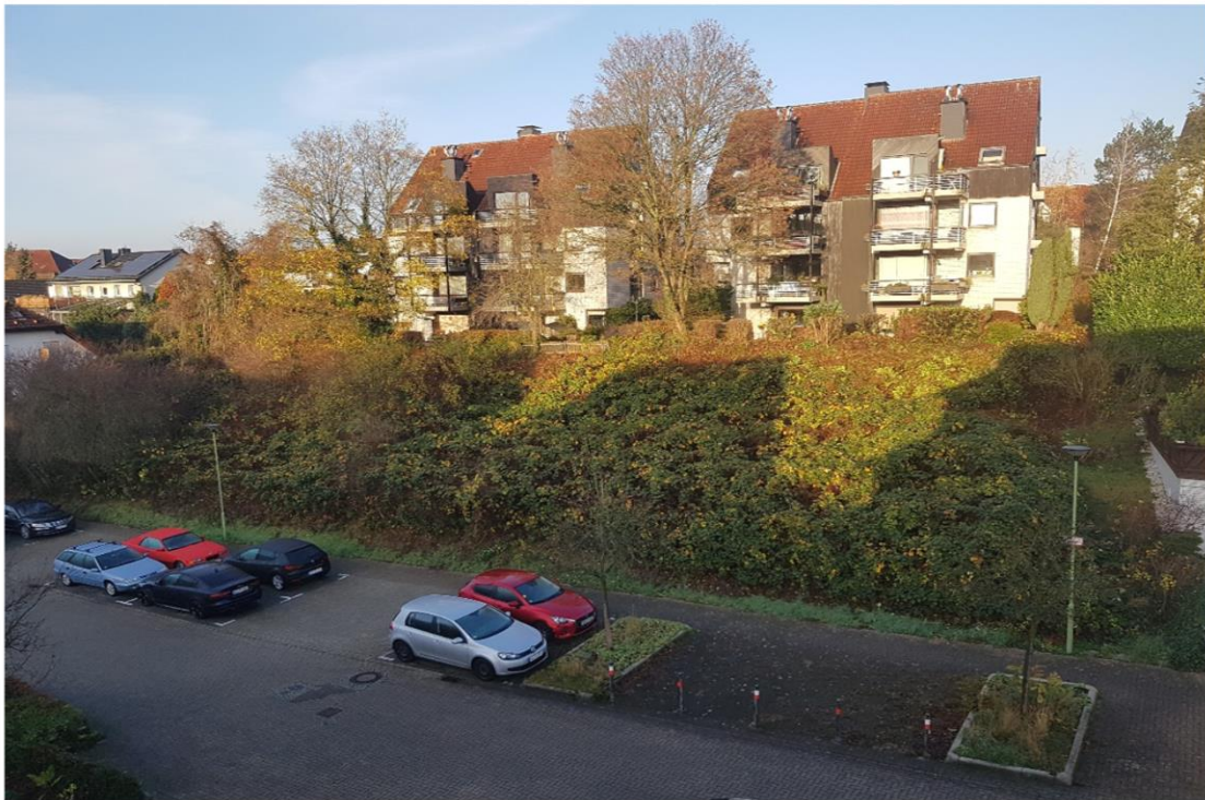
Bilder von den beiden Baugrundstücken